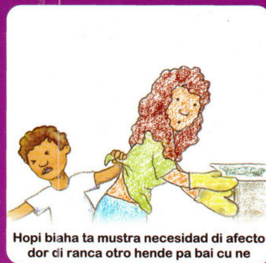
Hopi biaha ta muestra necesidad di afecto dor di ranca otro hende pa bai cu ne